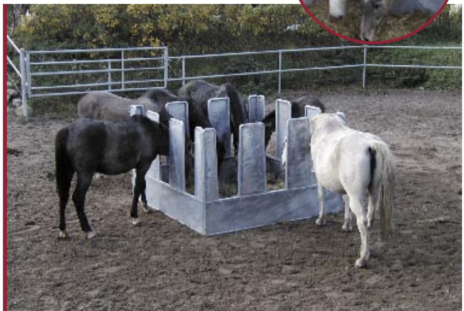
Con 4 elementos Horseking se consigue una instalación cerrada en cuadro