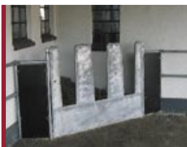
Instalación en rincón