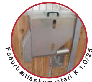
Fóðurbætisskammtari K 1.0/25