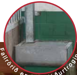
Fallrörið endar í fóðurtroginu

Brautarsporinu á hesthúsganginum er komið fyrir eftir því sem best hentar í hverju húsi miðað við allar aðstæður. Þannig er t.d. hægt að hafa á sporinu mjög krappar beygjur og jafnvel dálitlar brekkur.