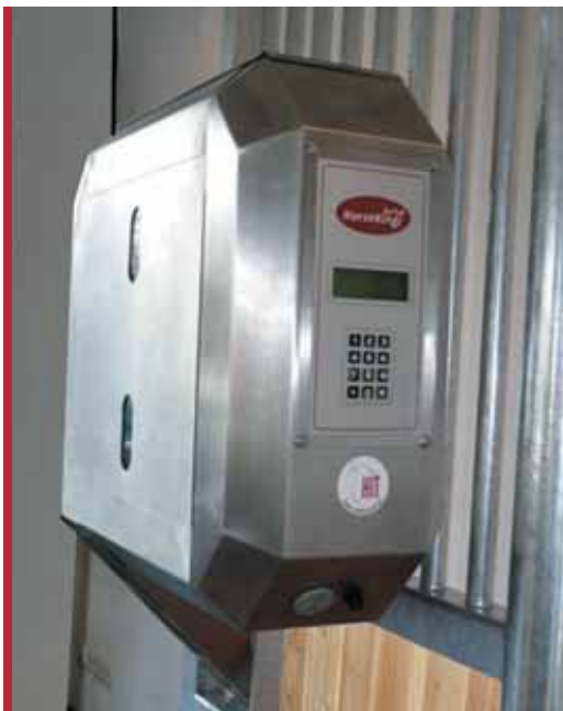
Fóðurbætisskammtari K 1.0/40 með innbyggðri gjafatölvu

Horseking-gjafakerfin eru mjög þægileg í uppsetningu, hvort sem er í gömlum hesthúsum eða nýjum. Uppsetningin er ákveðin í samræmi við annað skipulag í stíunum til að notagildi og útlit tengist hvert öðru á sem heppilegastan hátt.