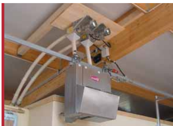
Við stíustangirnar eru festar slár sem tengjast sporinu fyrir skammtarann