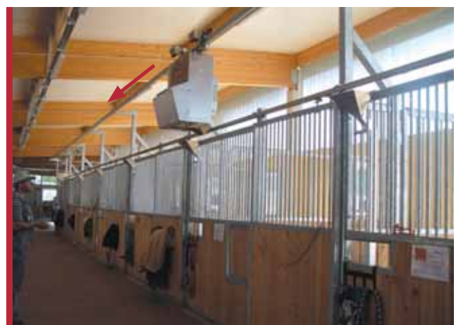
K100.0 á ferðinni við gjöfina