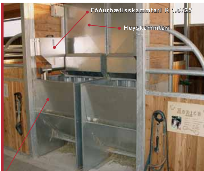
Fóðurbætisskammtari K 1.0/25