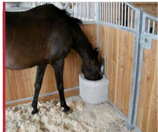
Staða hestsins eins og hann væri að bíta úti á túni