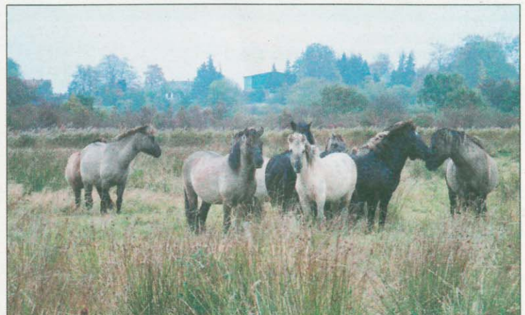
Die Koniks der Geltinger Birk leben das ganze Jahr über im Freien. Für die jungen Hengste gehört die ständige Überprüfung ihres Platzes in der Rangordnung zum Alltag.