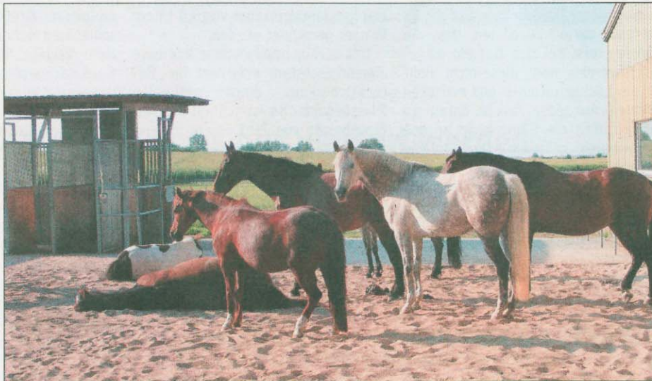
Die Pferde werden im Aktivstall langsam in die Herde eingeführt. Das sorgt für eine entspannte Atmosphäre.