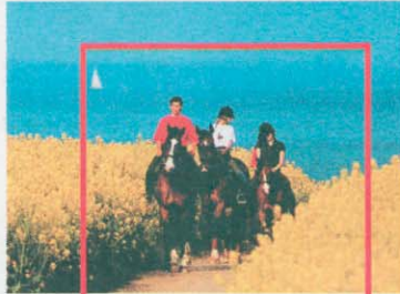
Pferd & Reiter