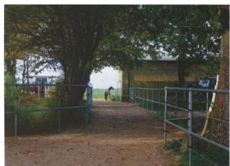
Parkanlage mit Zuwegung für die Pferde