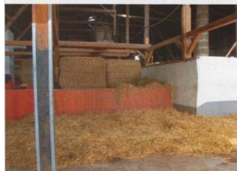
Liegehalle mit Stohfütterung